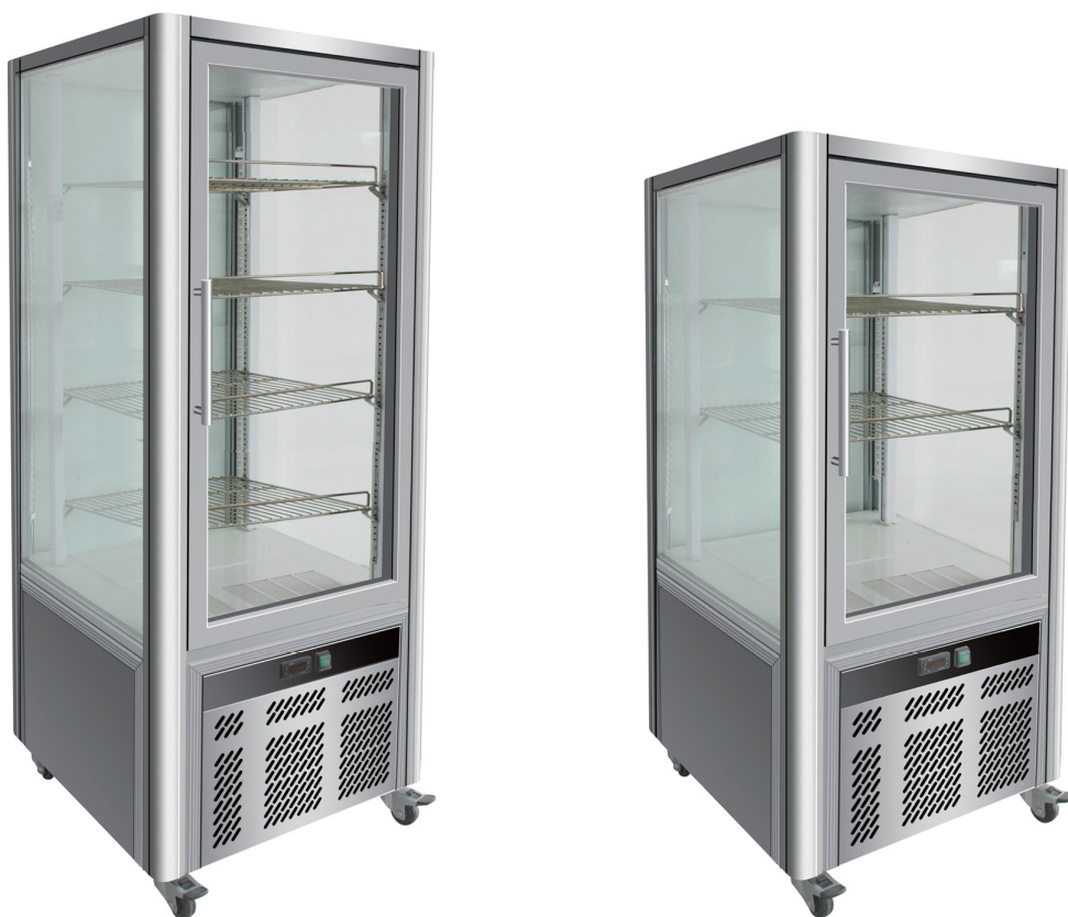
Chladené nerezové vitríny FORCAR® F852300 / F852301